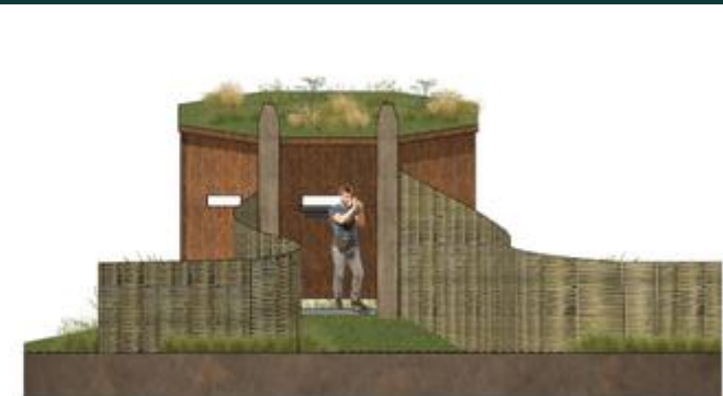
voor aanzicht 1:50