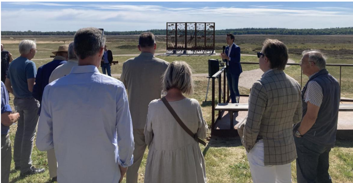
Opening Ontvangstlocatie Ginkel

Als VeluweAlliantie zijn we blij dat we bij hebben kunnen dragen aan deze mooie locatie.