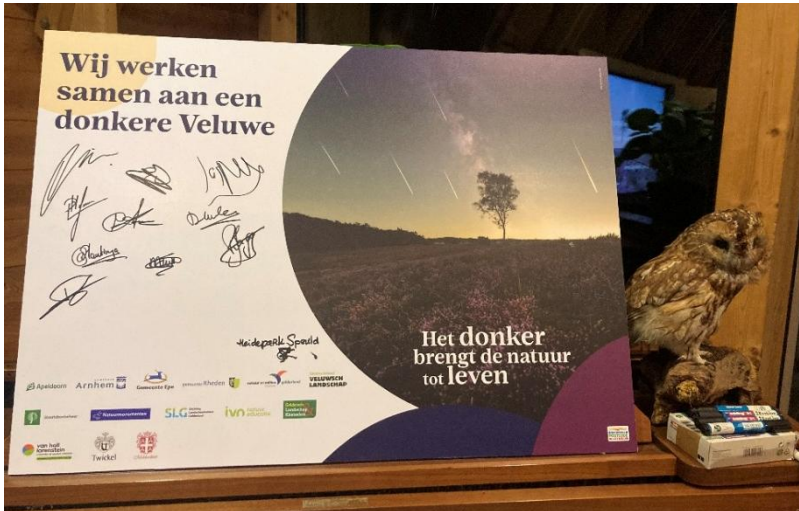
Ondertekening samenwerken voor een donkere Veluwe.