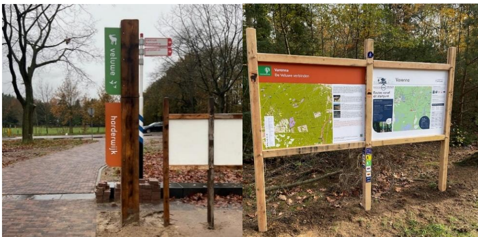
Bebording in nieuwe Veluwse stijl

De technische dienst van Routebureau Veluwe plaatste in 2025 al veel bijzondere elementen bij de eerste Ontvangstlocaties op de Veluwe. Jaren na de gehele uitwerking en vaststelling van de Veluwestijl is deze huisstijl nu op steeds meer locaties in de uitvoering te zien. Van borden tot palen en bankjes. Zo zorgen we voor een uniforme, natuurlijke en herkenbare uitstraling op de Veluwe.