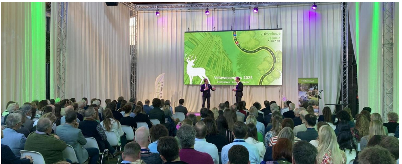
Impressie Veluwe Congres 2025

Een dag vol inspirerende verhalen en mooie netwerkmomenten.