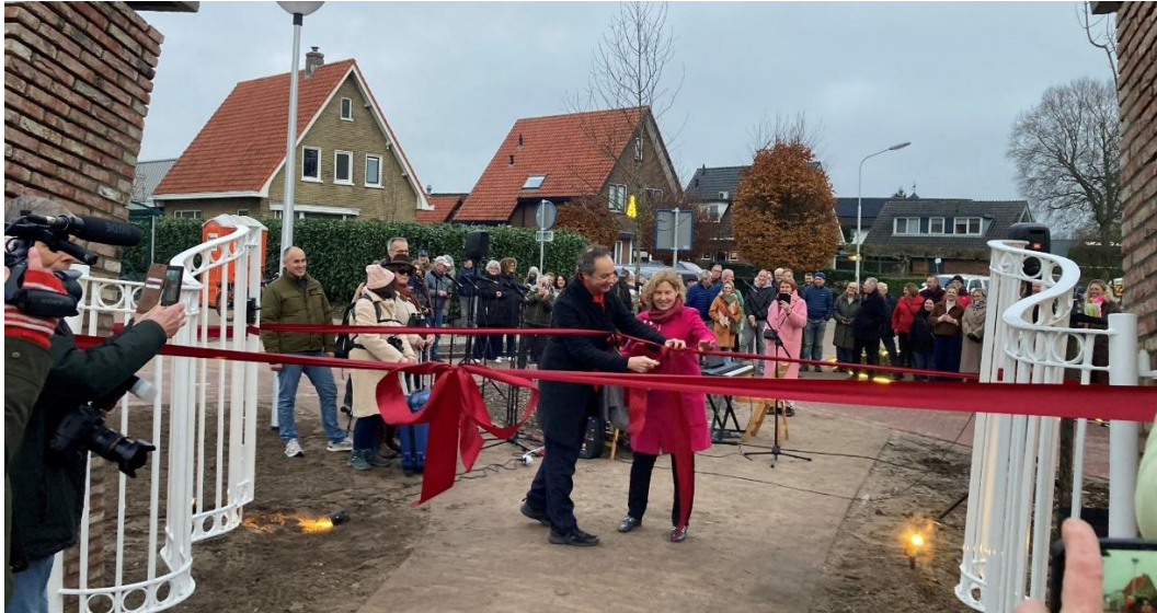
Opening kunstwerk 'Upwind Gate'

project is een samenwerking tussen o.a. Gemeente Ede, dorpsbelangenvereniging Otterlo's belang, Ondernemersvereniging Gastvrij Otterlo. Mooi dat we als VeluweAlliantie een bijdrage konden leveren aan dit project binnen het Veluws belevingsgebied Pure Veluwe.